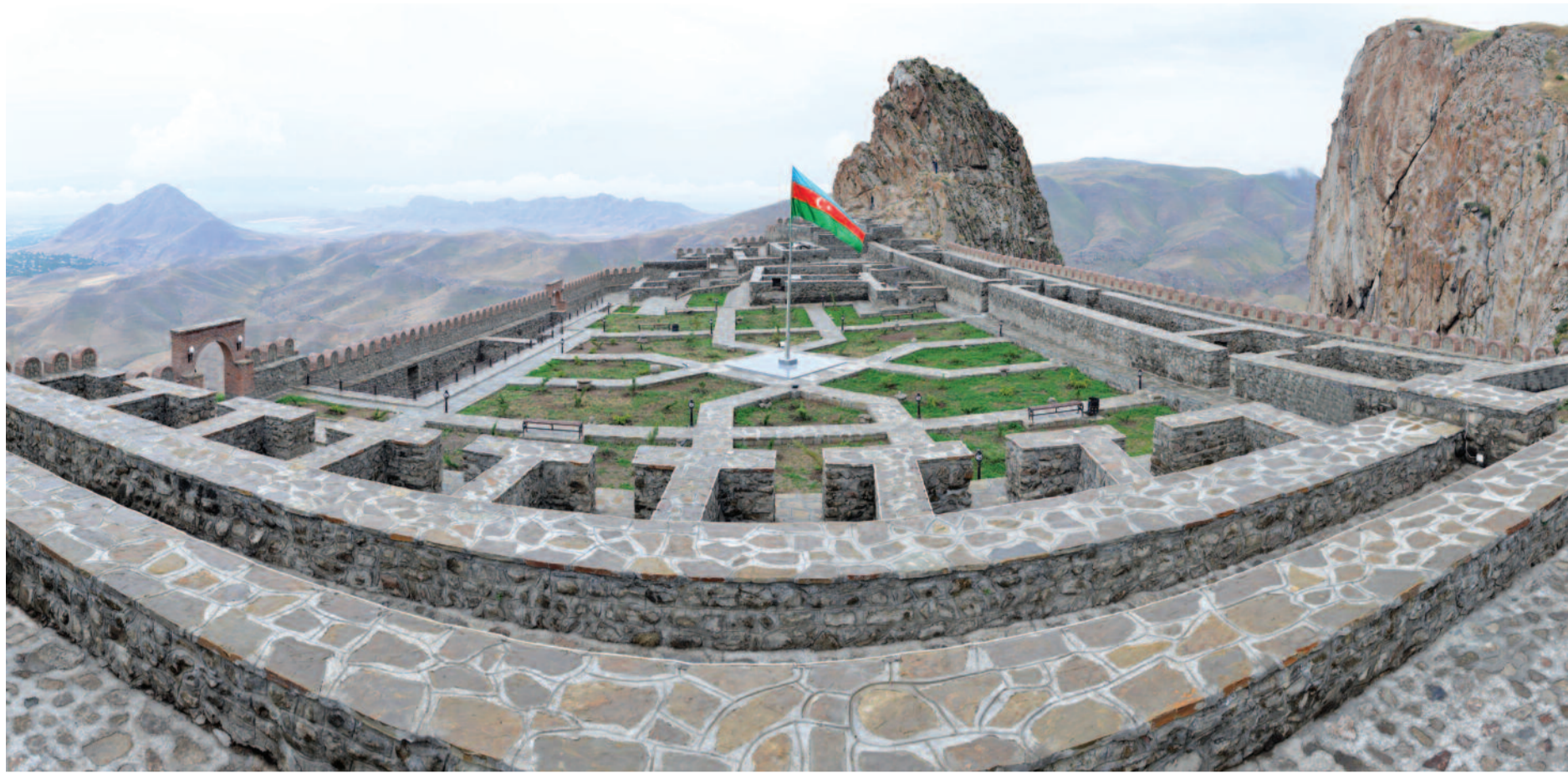
Tarixi abidələrimiz milli sərvətimizdir

Q ədim diyarımız Naxçıvan xalqımızın daş yaddaşı, misilsiz sərvəti olan, yaşı minilliklərə söykənən sirli-soraqlı tarixi abidələrlə zəngindir. Sevindirici haldır ki, bu gün təkcə paytaxt şəhərimizə deyil, muxtar respublikamızın hansı səmtinə üz tutsan, orada hər daşı-qayası min bir tarix danışan, şanlı keçmişin yadigarı olan, dünəndən bu günə işıq salan abidələr mövcuddur. Elə götürək Naxçıvanın Şərqi açılan qapısı Culfa rayonunu... Xalqımızın mərdlik, yenilməzlik, mübarizlik rəmzi – Əlinca qalası, Azərbaycan memarlığının əvəzsiz nümunəsi – Güllüstan türbəsi, qədim insanların müdafiə istehkamu – Qazançı qalası, qoca Şərqi memarlıq incisi, şeyxlər ocağı – Xanəgah abidə kompleksi, əcdadlarımızın iman yeri, zikir evi – Kırna türbəsi ulu diyarımızın tarixi zənginliyindən xəbər verən abidələrdir.